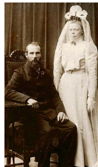
Konsentrerte og nygifte hos fotografen. Tromsø, 1905.

– Jeg forsøker konstant å forutse hva som kommer til å skje,